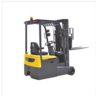
CARRETILLA ELEVADORA ELÉCTRICA