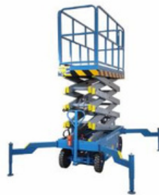
PLATAFORMA AÉREA TIJERA