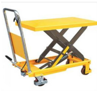
MESA ELEVADORA TIJERA