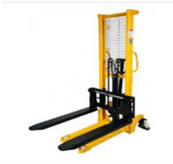
CARRETILA ELEVADORA HIDRÁULICA