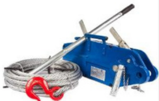
CABRESTANTE MANUAL DE CABLE