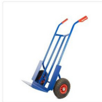
CARRO DE MANO